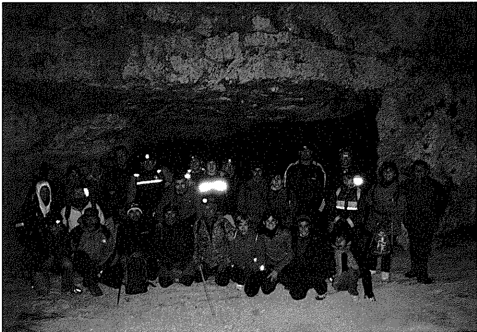
20 de novembre. XIII Sortida Lluna Plena a la Foradada