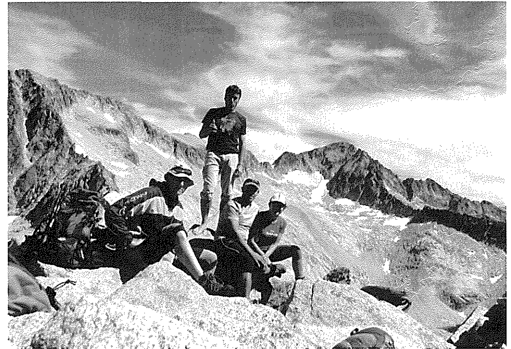
11 de setembre. Pic Aragüells, 3.005 msnm. Pirineus centrals