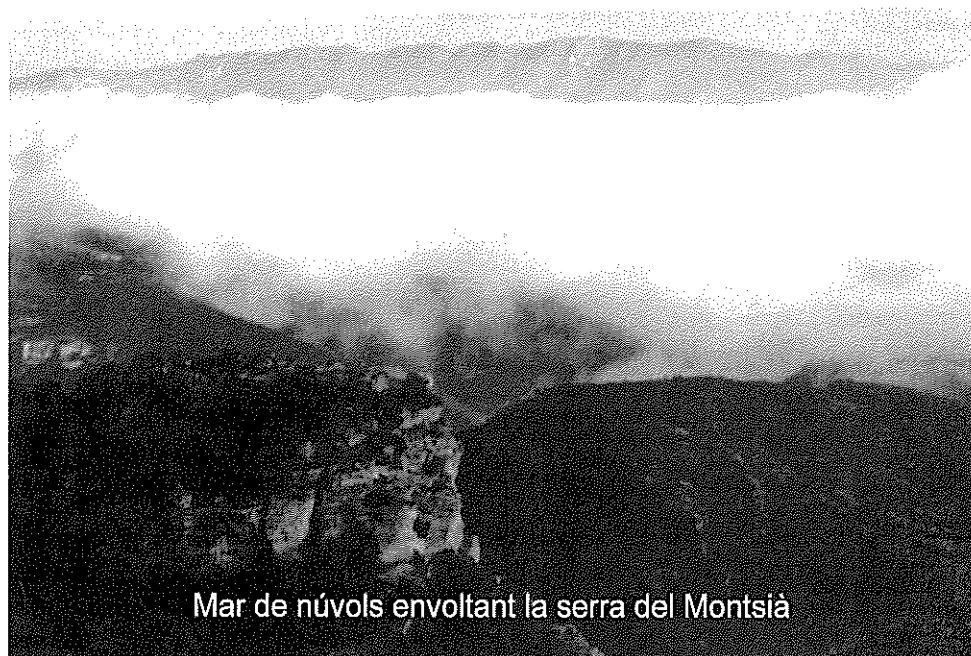
Mar de núvols envoltant la serra del Montsià

BUTLLETÍ INFORMATIU núm. 58 · gener/juny 2011