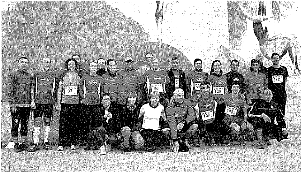
24 d'octubre. 3a Cursa de Muntanya d'Uldecona