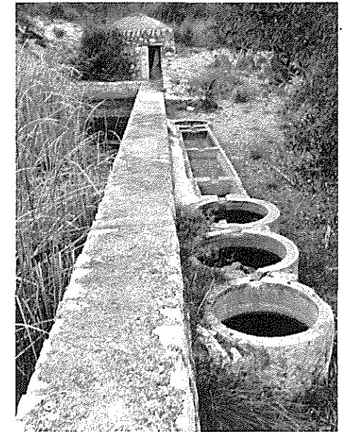
Bassa i piques de la font de la Gotellera. Serra del Montsià