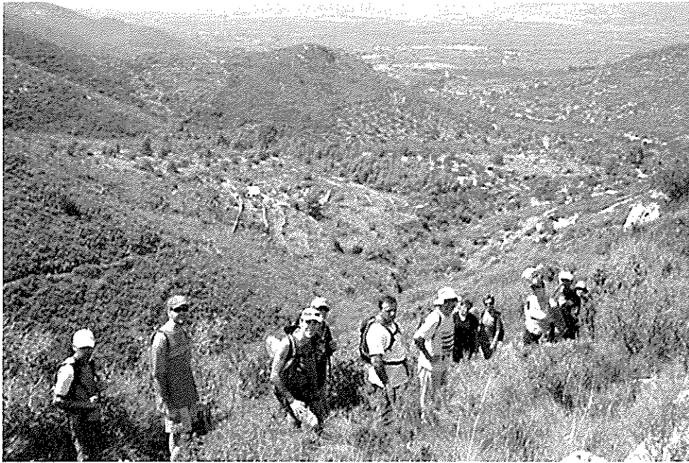
24 d'agost. Excursió popular pel Montsià durant les Festes Majors