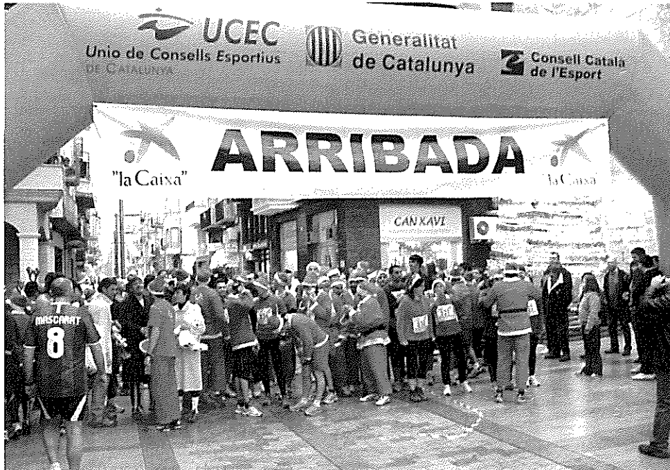
31 de desembre. I San Silvestre d'Uldecona