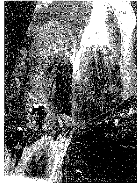
7 d'agost. Canyó d'Olhadubi, Pirineus francesos