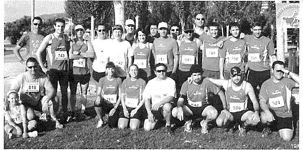
Els participants falduts de la Cursa de La Ràpita